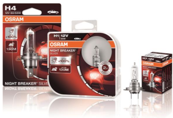
NIGHT BREAKER® SILVER

Лампы OSRAM NIGHT BREAKER® задают новые стандарты автомобильного освещения, обеспечивая непревзойденную видимость на дороге.