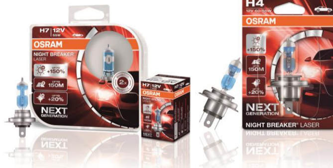
NIGHT BREAKER® LASER