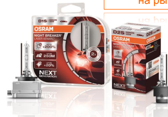
XENARC® NIGHT BREAKER® LASER